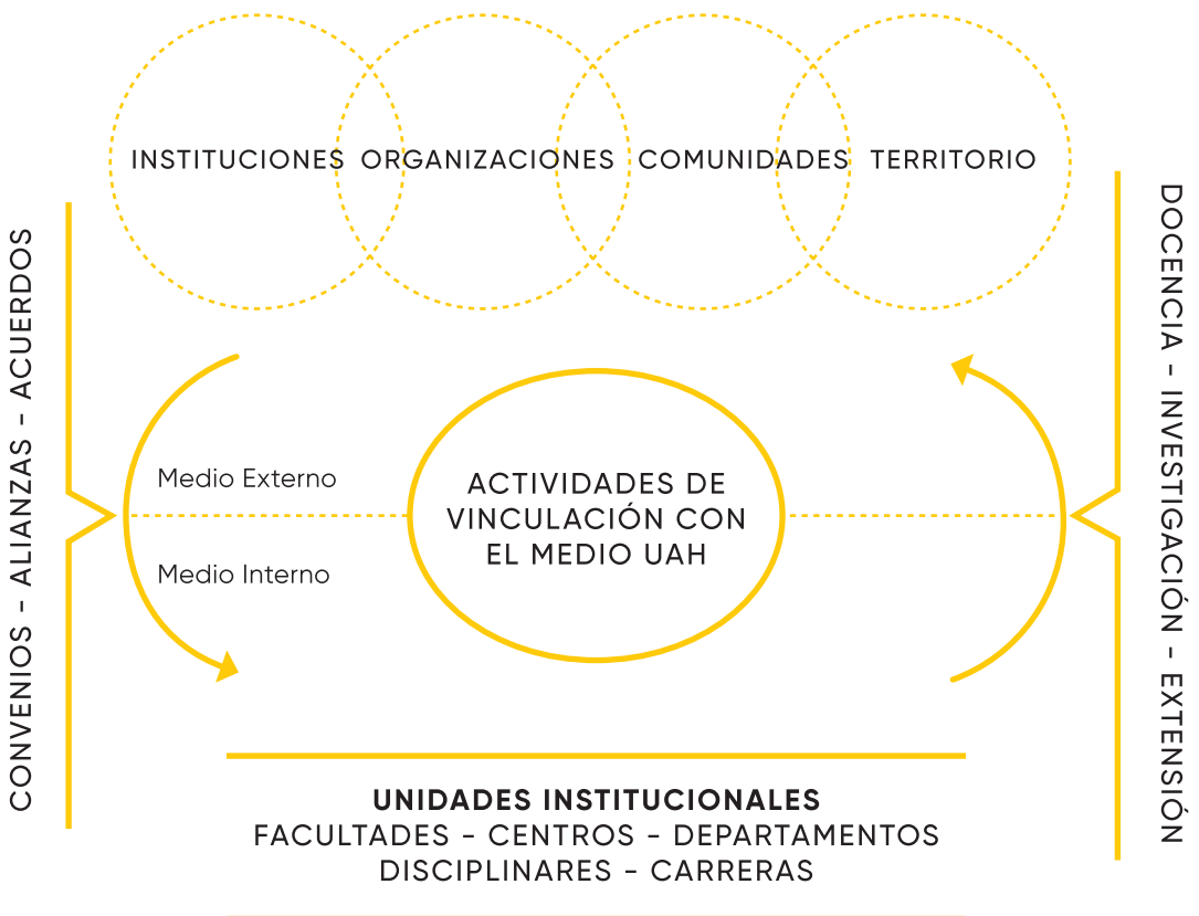
Esquema de Vinculación con el Medio